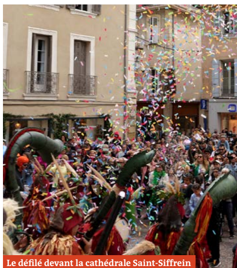
Le défilé devant la cathédrale Saint-Siffrein

Merci à tous d'être venus en nombre participer à cette tradition provençale qu'est le carnaval suivi de la mise au bûcher du Caramentran. Pour rappel, à travers lui, c'est l'hiver qu'on juge. Il est accusé de tous les maux : épidémie, mauvaises récoltes, gel, sécheresse... Aujourd'hui, Caramentran porte tous les péchés de la communauté et on rejette sur lui tous les malheurs de l'année écoulée. On érige donc sur la place publique le mannequin coloré que l'on a fabriqué et pour clôturer le défilé, la foule déguisée lui fait un procès. Il est jugé par un tribunal populaire composé des habitants. Et vous avez été nombreux à crier haut et fort votre envie de le condamner ! Récit en photos de cette belle journée à Carpentras.