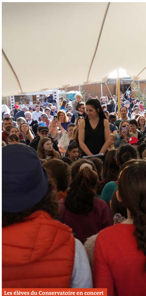
Les élèves du Conservatoire en concert