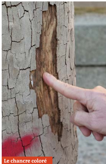
Le chancre coloré

Vous l'avez peut-être remarqué, 9 platanes ont dû être abattus dernièrement. Ces arbres étaient malheureusement porteurs du chancre coloré qui présente un réel danger de nature à compromettre l'avenir des platanes dans tout le département du Vaucluse. Supprimer les éléments touchés permet de lutter contre ce champignon nuisible et sa propagation. L'État oblige d'ailleurs l'abattage des arbres contaminés pour préserver les sujets encore sains.