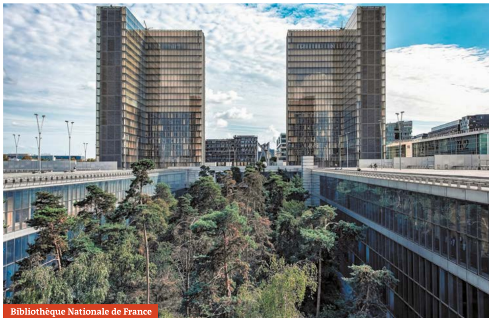
Bibliothèque Nationale de France