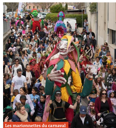
Les marionnettes du carnaval