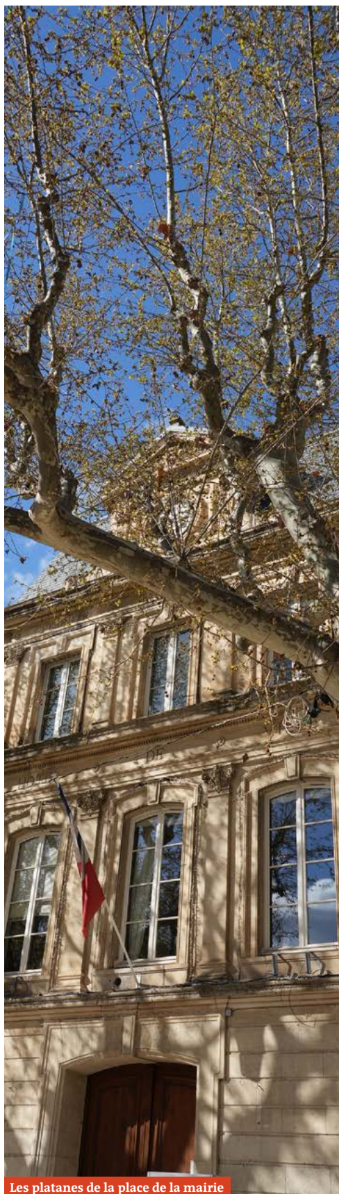
Les platanes de la place de la mairie