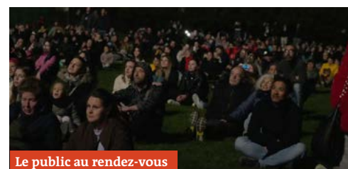
Le public au rendez-vous