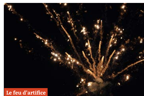
Le feu d'artifice