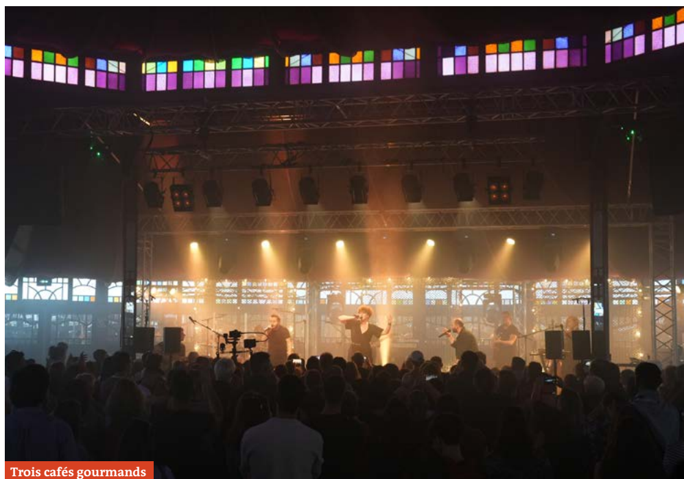
Trois cafés gourmands