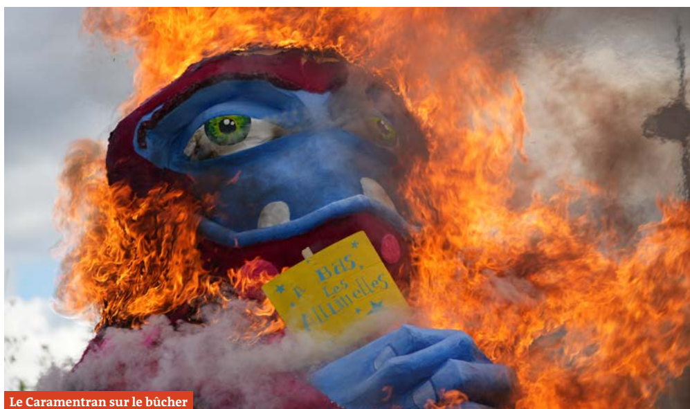
Le Caramentran sur le bûcher