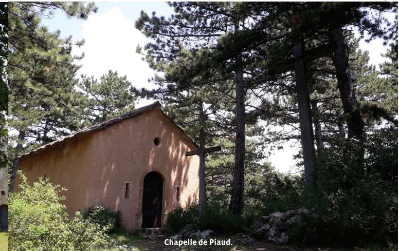
Chapelle de Piaud.

Balisage : GR (rouge/blanc) + PR (jaune) Ref carte IGN : TOP25 3140ET : Mont Ventoux