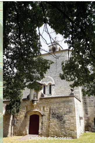
Chapelle du Groseau.