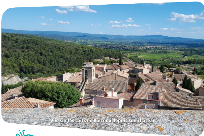
Vue sur les toits de Barroux depuis son château