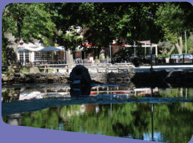
Source du Groseau.

À la sortie du village de Malaucène, sur la route qui mène au sommet du Ventoux, faire halte à la magnifique chapelle romane Notre-Dame du Groseau , ancienne résidence du Pape Clément V, puis se rafraîchir à la source du Groseau pour profiter d'un petit moment de plénitude. Vénérée depuis l'Antiquité, canalisée au 16 e siècle et remaniée au 18 e siècle, la source est aujourd'hui classée patrimoine remarquable.