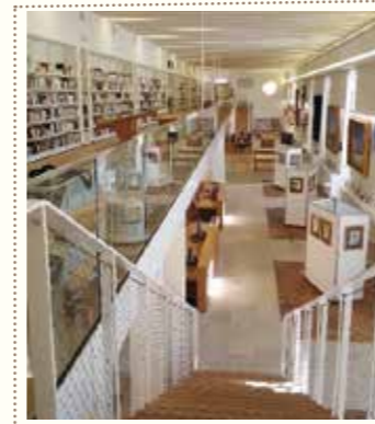
2 L'INGUIBERTINE A L'HÔTEL DIEU - Bibliothèque musée

The Rampart See the renovation of a fragment of the ancient wall.