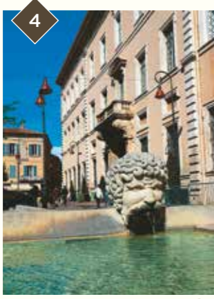
4 PALAIS DE JUSTICE ANCIEN PALAIS EPISCOPAL

Petit détour : Le portail méridional sur la place Saint-Siffrein / Also see the southern door into the cathedral on Place Saint-Siffrein (Suivre itinéraire jaune sur le plan)