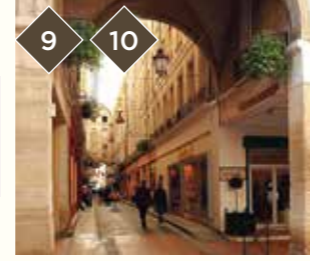
9 LES HALLES LE PASSAGE BOYER

Petit détour : La place du Marché aux Oiseaux, l'église de l'Observance et la Piscine couverte de style art déco (suivre itinéraire jaune sur le plan)