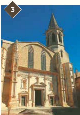
3 LA CATHÉDRALE ST-SIFFREIN

OUVERT Petit détour rue Moricelly : Hôtels particuliers du XVII e et XVIII e (Suivre itinéraire jaune sur le plan) / Bourgeois homes from the 17 th and 18 th centuries