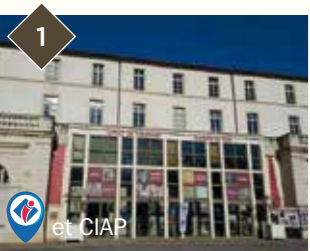
1 ANCIEN COUVENT DES DOMINICAINS