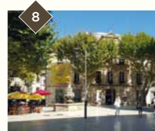
8 PLACE DE L'HÔTEL DE VILLE ET LA FONTAINE DE L'ANGE

OUVERT Du lundi au jeudi à 10h, 11h, 14h, 15h, 16h. Le vendredi à 10h, 11h, 14h, 15h. Fermée les jours fériés. Tarifs : 5€